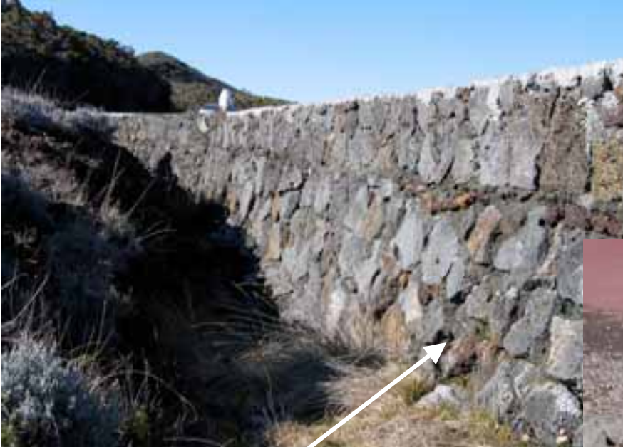
Muret de soutènement en maçonnerie de moellons