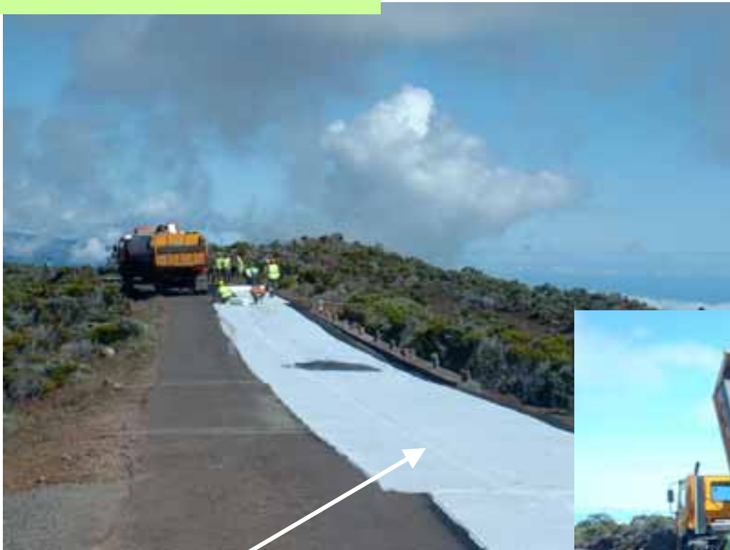
Pose d'un géotextile