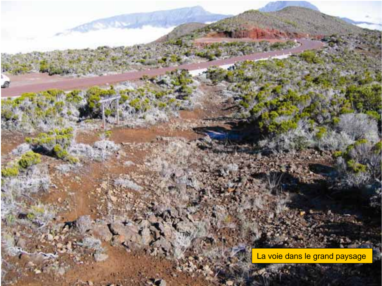
La voie dans le grand paysage