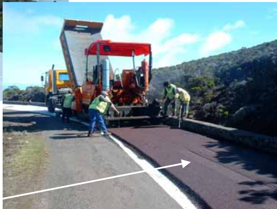
Pose de l'enrobé brun-rouge