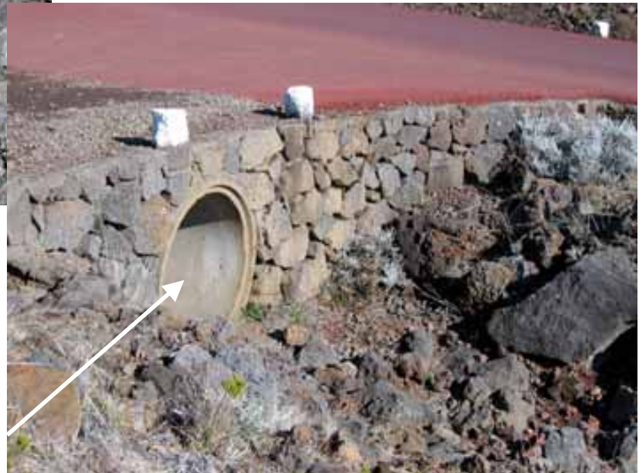
Intégration d'un ouvrage hydraulique