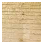
Le robinier faux-acacia

Nos équipes vous accompagnent à toutes les étapes de votre projet