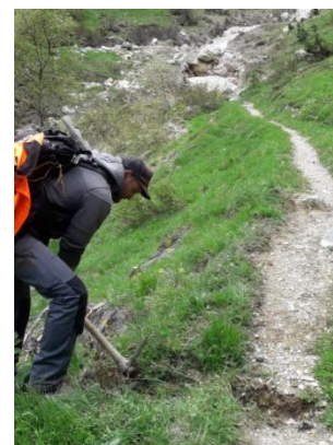
Entretien des sentiers – 16/06/2020

Grâce à ses 80 techniciens, ses chefs de projets et ses 150 ouvriers forestiers, l'ONF en Savoie assure un niveau de travaux très important en faveur des forêts et des espaces : c'est un chiffre d'affaire de 6M€ et une activité de plus de 100 000 heures qui sont réalisés et contribuent ainsi au développement et à l'emploi local.