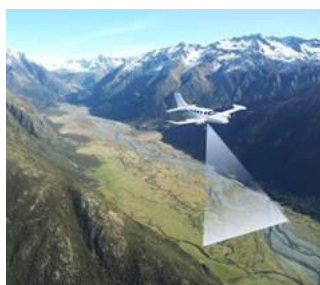
Principe du vol LIDAR

En charge de gérer 105 000 hectares de forêts publiques sur le territoire de la Savoie, les missions de l'ONF sur le département sont multiples. Au cours de l'année 2020, et malgré les difficultés relatives aux conditions sanitaires et aux périodes de confinement, les agents de l'ONF ont rempli leurs missions tout au long de l'année.