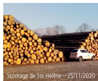
Stockage de Ste Hélène – 25/11/2020

Pour optimiser les liaisons au sein de la filière locale et assurer un approvisionnement des bois de montagne pendant 12 mois aux scieurs de la Savoie, plusieurs plateformes de stockage ont pu être valorisées au cours de l'année : une plateforme a été créée en forêt domaniale du Morel à Grand Aigueblanche , la plateforme de Sainte Hélène ( CA Arlysière ) a pu être utilisée par l'association des communes forestières et la plateforme des Cèillettes ( CC Maurienne Galibier ) a servi tout au long de l'année. Plusieurs milliers de mètres cubes de bois d'œuvre , destinés aux principaux scieurs des Alpes, y sont stockés au cours de l'hiver pour leur permettre un enlèvement progressif au fur et à mesure de leur besoin.