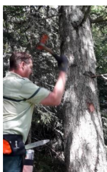
Martelage en FC de Queige 23/06/2020

En application de ces documents de gestion qui couvrent 100% des surfaces gérées par l'ONF en Savoie, les techniciens ont procédé au martelage des arbres en vue de leur commercialisation. En adaptant les prélèvements aux conditions de crise européenne sur le marché du bois (crise scolyte), les martelages ont représenté 125 000 m3 de bois qui seront commercialisés aux entreprises locales.