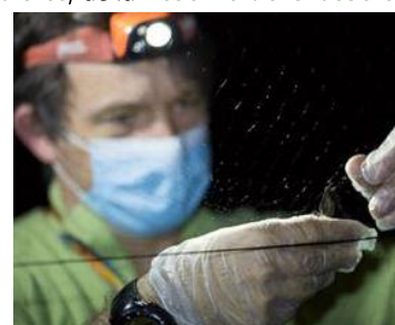
Capture scientifique d'une chauve-souris 20/07/2020

Ces actions contribuent aux politiques nationales en faveur de la protection de la biodiversité. Dans ce cadre, une grande campagne de radiopistage de chauves-souris a eu lieu aux Saisies en juillet pour mieux connaître et comprendre le comportement de ces mammifères volants.