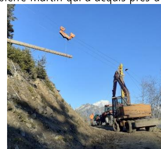
Exploitation par câble à Beaufort 18/11/2020

En 2020, le principal acheteur de bois des forêts publiques en Savoie est l'entreprise Scierie De Savoie Lapiere-Martin qui a acquis près de 50 000 m3 de bois, dont la moitié en contrat d'approvisionnement de bois façonné. Grâce à la mobilisation des élus, des bûcherons et des techniciens de l'ONF, l'exploitation des bois dans les forêts a pu se maintenir malgré le contexte économique et sanitaire .