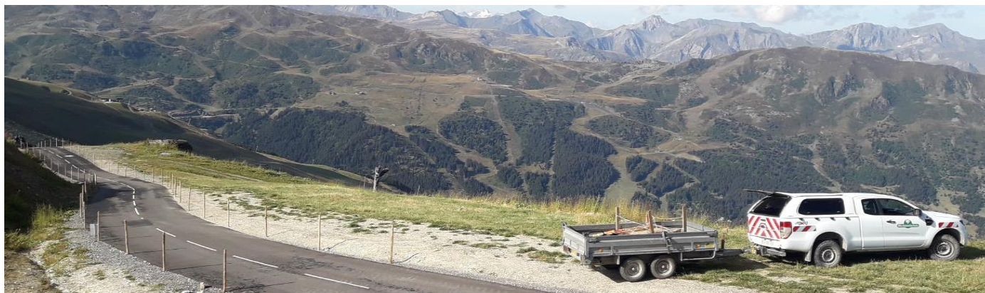
Col de la Loze – Tour de France 2021 – Travaux de préparation confiés aux équipes de l'ONF -