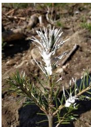
Protection des jeunes plants – 09/04/2020

Bien que perturbée par le confinement de l'automne, les actions de chasse se sont poursuivies dans le respect des règles sanitaires au sein des forêts domaniales et des forêts communales pour permettre la régulation des populations d'ongulés et le maintien ou la restauration de l'équilibre sylvo-cynégétique . Parallèlement, des tests de protection ont été réalisés par les équipes chargées de sylviculture pour protéger les jeunes plants en forêt.