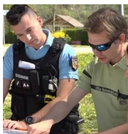
Mission de police – 09/04/2020

En appui des services de l'Etat, les équipes de l'ONF ont réalisé de nombreuses actions de police des milieux naturels pour faire appliquer la réglementation en vigueur malgré la forte affluence. Au cours du deuxième confinement, en période de chasse, ces actions de police ont permis d'assurer une bonne articulation entre les utilisateurs des espaces forestiers.