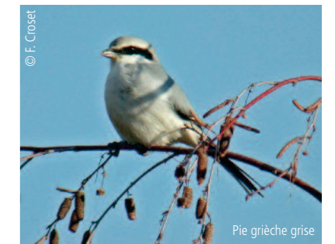
Pie grièche grise

Depuis 50 ans, l'Office national des forêts œuvre pour la gestion forestière durable des forêts publiques. Dès le XIV e siècle, des générations de forestiers veillent sur la forêt domaniale. La très célèbre ordonnance de Colbert de 1669 vient fixer les éléments opérationnels des principes de gestion durable. Dans cette lignée, l'ONF gère 11 millions d'hectares de forêts publiques (État et collectivités) en métropole et dans les territoires d'Outre-mer. Ces forêts produisent 40 %