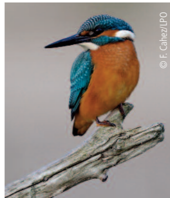
Martin pêcheur : exemple d'espèces identifiées comme en forte régression

Nous vous invitons à découvrir la synthèse de ce travail sur le site de l'INPN : http://inpn.mnhn.fr/docs/Resultats-SynthetiquesRapportage2014DO.xls