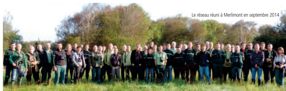
Le réseau réuni à Merlimont en septembre 2014