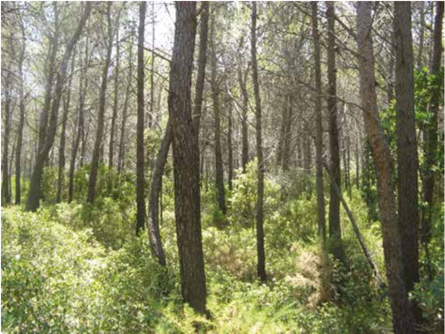
Peuplement avant première éclaircie (FC Ceyreste ; 13)

La mortalité des arbres restés en place se stabilise au bout de 5 ans mais il est conseillé de réaliser l'exploitation dès la première année, après la fin de l'hiver. Une exploitation tardive cause des dégâts aux semis.