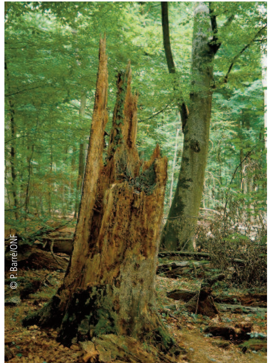
Réserve biologique intégrale