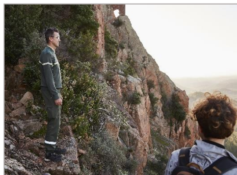
Forestier sur le sentier d'accès à la Sainte-Baume avec une randonneuse, forêt domaniale de l'Estérel.

Ainsi, pour répondre à ces objectifs, les équipes de l'ONF vont, dans les mois à venir, mener un véritable travail d'aménagement naturel, avec la reconstruction de murets en pierre et condamner les sentiers sauvages, qui favorisent l'érosion et la destruction de milieux, de la faune et de la flore. L'ONF va travailler à partir de sentiers déjà existants. Maintenir en bon état et restaurer ces sentiers, c'est offrir la possibilité de transmettre aux générations futures ce patrimoine paysager, ethnologique et historique ! C'est aussi préserver la qualité de ces espaces, la quiétude des milieux et favoriser un développement touristique durable et contrôlé.