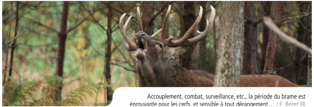
Accouplement, combat, surveillance, etc., la période du brame est éprouvante pour les cerfs, et sensible à tout dérangement...