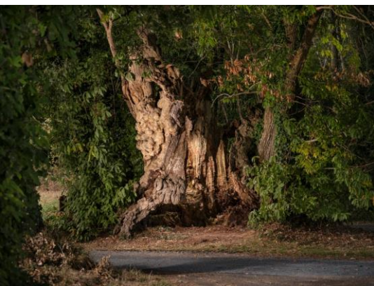
Le châtaignier « la talle à teurtous », Prix du Jury 2021