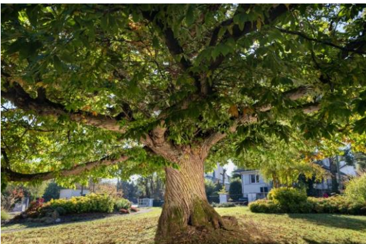
Le châtaignier de la place Audran, Prix du Public 2021.