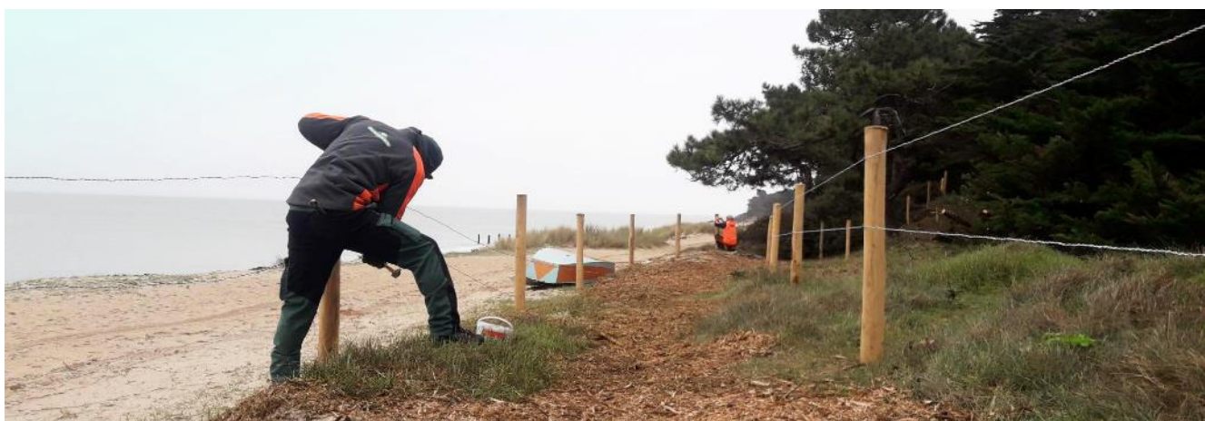
Légendes // Photo 1 : cordon dunaire mis en défens à l'aide de ganivelle ; Photo 2 : Dépôt de branchages provenant du chantier du site de La Clère pour piéger le sable et enrichir la dune ; Photo 3 : Création de la nouvelle itinérance à travers le boisement, broyat de cyprès pour tapisser le sol ; Photo 4 : Sentiers en cours par les équipes de l'ONF