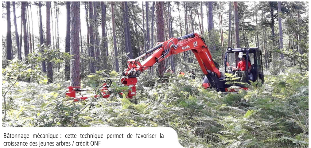
Bâtonnage mécanique : cette technique permet de favoriser la croissance des jeunes arbres

Spécialement conçu pour une opération peu connue mais pourtant vitale pour les jeunes forêts : voici le batonneur mécanique pour battre les fougères aigles ! Ce drôle d'engin va intervenir dans plusieurs forêts domaniales de la région des Pays de la Loire. Déjà réalisés sur Mervent (Vendée) et sur Bercé (Sarthe) début juin, les prochains chantiers se joueront tous en Maine-Loire jusqu'à début juillet (en forêts domaniales de Monaie-Pontménard sur 46 ha, Milly sur 10 ha et enfin Longuenée sur 6,5 ha - mais aussi en forêts communales de Brain sur Allonnes et Soucelles). C'est alors une course contre la montre qui se joue pour les forestiers car intervenir trop tard peut représenter un risque pour les jeunes pousses.