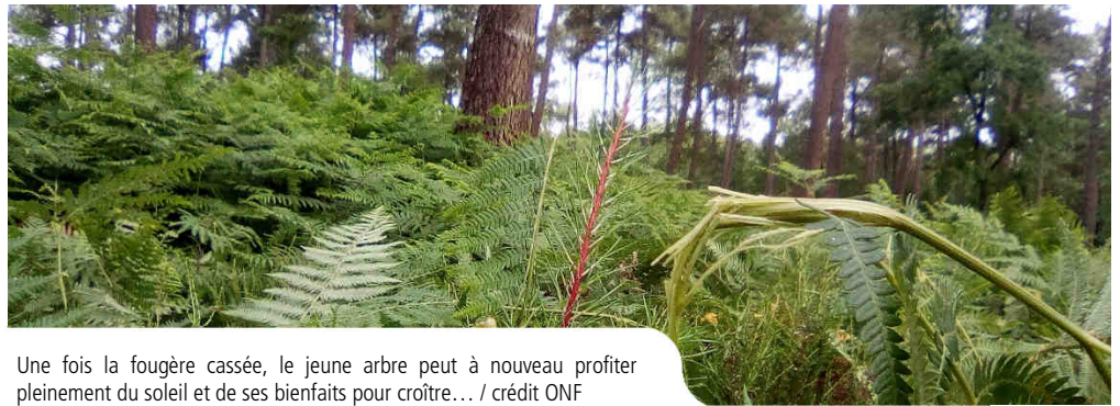
Une fois la fougère cassée, le jeune arbre peut à nouveau profiter pleinement du soleil et de ses bienfaits pour croître...

Sur une surface forestière concernée, le bâtonnage est en général pratiqué une fois par an durant trois ans, le temps que les jeunes arbres poussent et dépassent les fougères !