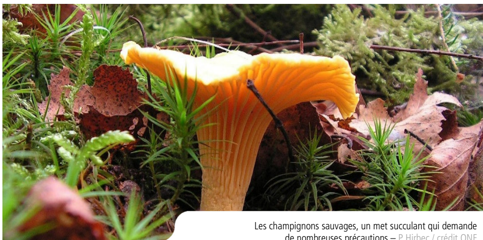
Les champignons sauvages, un met succulent qui demande de nombreuses précautions

L'automne est là et la cueillette des champignons, seul ou en famille, va reprendre de plus belle. Cette activité attire de plus en plus d'amateurs et de curieux en tout genre. Certains reviennent le panier plein, d'autres les mains vides.