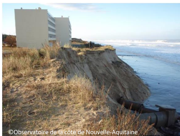
Erosion majeure au droit de l'immeuble Le Signal (Soulac-sur-Mer) séparé du haut de falaise par 15 m de dune

L'hiver 2013-2014 a été marqué par une succession de tempêtes sur le littoral atlantique, qui ont significativement impacté le cordon dunaire régional.