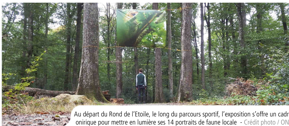
Au départ du Rond de l'Etoile, le long du parcours sportif, l'exposition s'offre un cadre onirique pour mettre en lumière ses 14 portraits de faune locale

A l'occasion de la Fête de la Nature 2020, et dans le cadre de sa convention pluriannuelle « Contrat L.A. Nature » avec le département de Loire-Atlantique, l'ONF propose à tous une exposition dédiée à la faune de la forêt domaniale du Gâvre. Disséminée à partir du 7 octobre le long du parcours sportif au départ du Rond de l'Etoile, l'exposition « Un œil en forêt » propose 14 portraits originaux d'espèces prises sur le vif par les naturalistes de l'ONF.