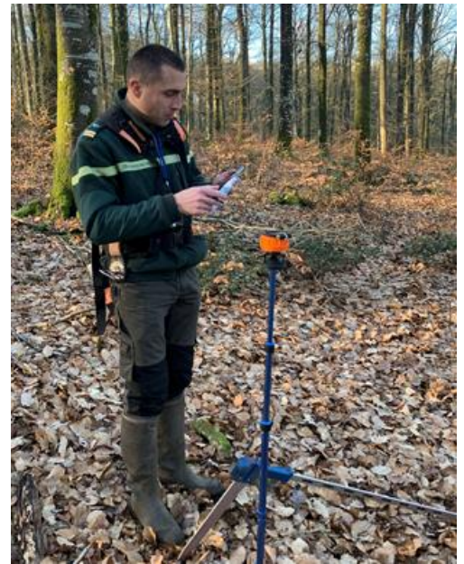
« Journée de description des peuplements forestiers »

Cette campagne de terrain permet d'acquérir une connaissance synthétique des essences principales qui composent la forêt telles que le chêne ou le hêtre mais également leur diamètre et leur hauteur.