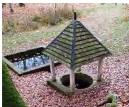
Fontaine de la Coudre