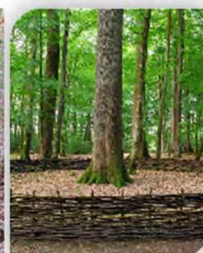
Futaie des Clos

Le lien social et la convivialité s'illustrent dans le Vallon de l'Hermitière, l'eau est mise à l'honneur à la fontaine de la Coudre, la futaie des Clos symbolise l'arbre et la sylviculture. Bien que ces lieux concentrent l'essentiel de la fréquentation, leurs thématiques associées, « l'homme, l'arbre et l'eau » représentent trois clés de lecture, trois approches complémentaires de la forêt.