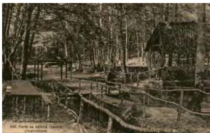
Vallon de l'Hermitière au 19e siècle

Entendre de Bercé qu'elle est la « forêt des hommes » peut sonner comme une banalité. Les liens qui unissent Bercé aux hommes sont sans doute plus solides et plus étroits ici qu'ailleurs. En témoignent les dernières découvertes archéologiques, les divers indices dévoilés par la toponymie ou, plus près de nous, la fierté des riverains conscients du caractère exceptionnel de ce « Poumon vert », patrimoine du Pays Vallée du Loir et source de développement local. Cette relation constitue le socle du projet Bercé Forêt d'Exception® et donne tout son sens à la démarche collective menée à l'échelle du territoire.