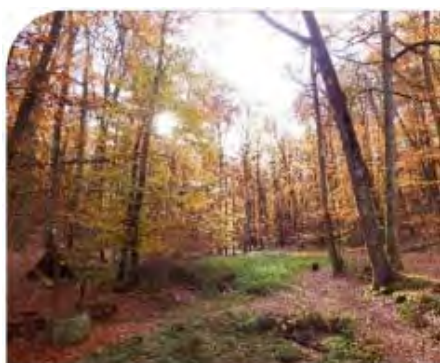
Vallon de l'Hermitière

Outre la qualité de ses bois et la hauteur de ses futaies, la notoriété de Bercé repose également sur trois sites emblématiques, connus depuis des décennies et bien identifiés par la population locale. Abondamment représentés dans l'iconographie du massif, notamment dans de nombreuses cartes postales datant du début du XX e siècle, ils révèlent chacun une part essentielle de « l'esprit des lieux ».