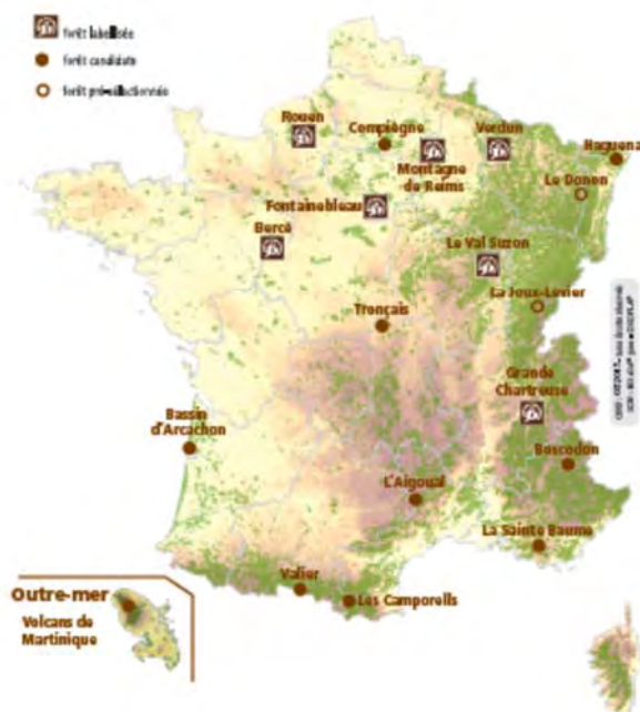
Label Forêt d'Exception® 19 forêts lancées dans la démarche

Le label Forêt d'Exception® consacre à la fois la qualité du site forestier, l'exemplarité de sa gestion et des partenariats engagés.