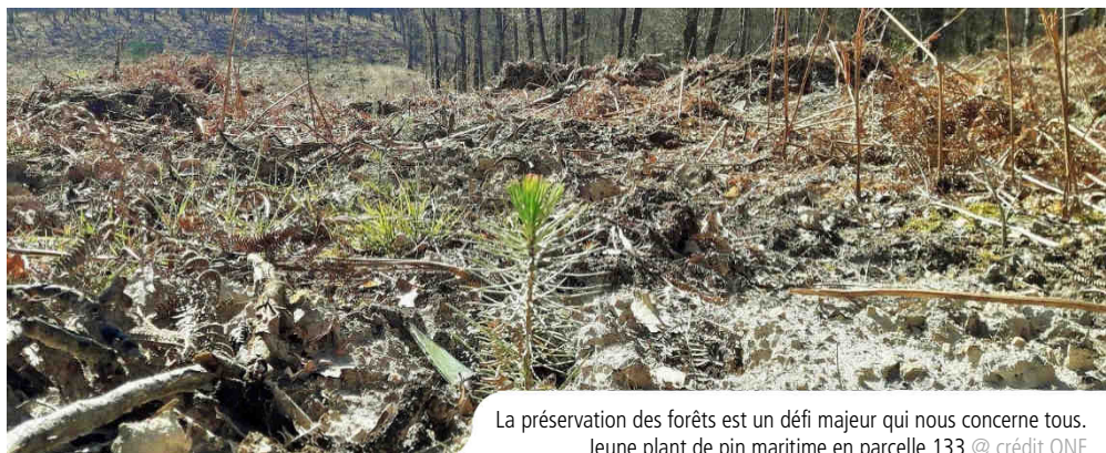
La préservation des forêts est un défi majeur qui nous concerne tous. Jeune plant de pin maritime en parcelle 133

Réservoirs de biodiversité, puits de carbone, sources de bien-être et leviers de développement d'une économie verte : les forêts sont essentielles à l'Homme et la planète. Dans un contexte d'accélération du changement climatique et d'érosion de la biodiversité, garantir leur vitalité est un enjeu majeur qui concerne la société tout entière. Avec le fonds de dotation ONF Agir pour la forêt, créé en novembre 2019, chacun peut se mobiliser et s'engager dans des actions concrètes pour préserver ce patrimoine naturel inestimable. En 2020, un premier projet de plantation a été entièrement financé par les dons des particuliers – et ce projet se situe en Sarthe, en forêt domaniale de Sillé.