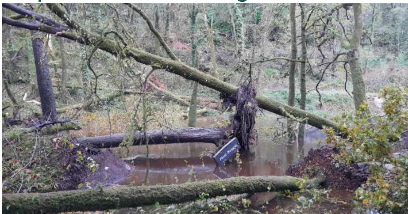
Le pont rouge en forêt de Huelgoat (29)

Avec des coups vents à 170 kilomètre / heure, ce sont les forêts du Finistère, du Morbihan et des Côtes d'Armor qui ont été le plus durement touchées suite aux passages des tempêtes CIARAN et DOMINGOS. En Ille et Vilaine, les forestiers de l'ONF n'ont relevé que quelques arbres renversés de manière éparse.