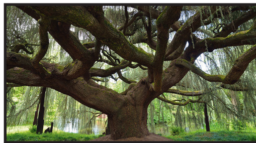
Prix du Jury 2015 Cèdre bleu pleureur de l'Atlas Arboretum de la Vallée-aux-Loups en Île-de-France