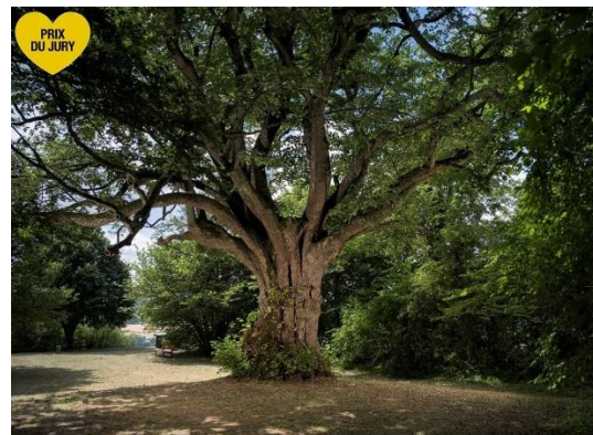
Tilleul de la colline Sainte-Hélène