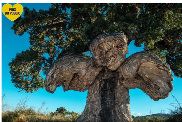
Le chêne liège – Una Suara

Le chêne liège - Una Suara , de Ghisonaccia (Corse) a recueilli 3053 votes et a reçu le prix du public des mains de Christian Dubreuil , directeur général de l'ONF.