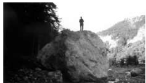
Torrent de Bragousse – à l'amont du B3 8 aout 1951