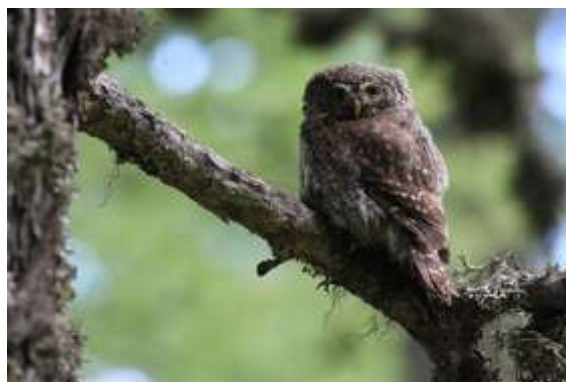
Chevêchette d'Europe

Temps de personnel apporté par chaque partenaire