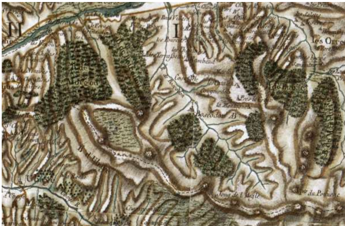
Extrait de la carte de Cassini