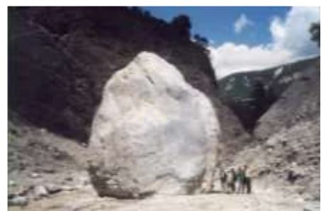
Torrent de Bragousse – à l'amont du B2 10 juin 1998

Taille du bloc : 11 m de haut, 26 m de circonférence, 250 m 3 , 500 tonnes