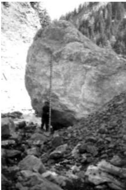
Torrent de Bragousse – entre le B2 et le CB2 05 aout 1946

C'est ce mécanisme qui permet au torrent de Bragousse de transporter des blocs énormes comme le témoignent les photos ci-après :