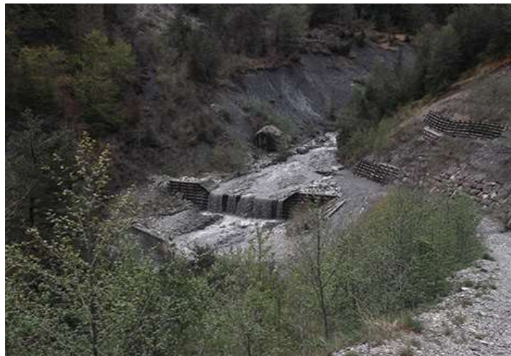
Torrent de l'Infernet (mai 2016)