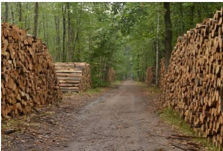
Le bois est entreposé en bordure de chemin avant d'être évacué.