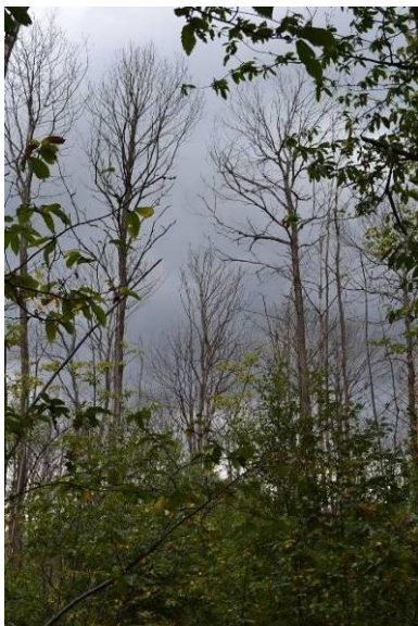
Image de châtaigniers atteints de la maladie de l'encre

Il n'y a pas de traitement pour lutter contre cette maladie.