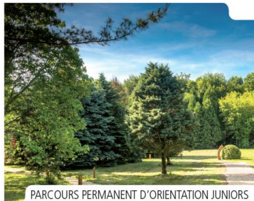
PARCOURS PERMANENT D'ORIENTATION JUNIORS