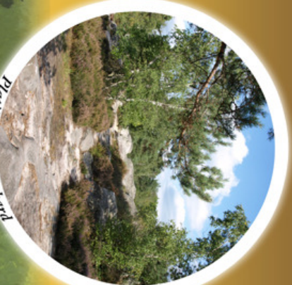
Platière de Franchard