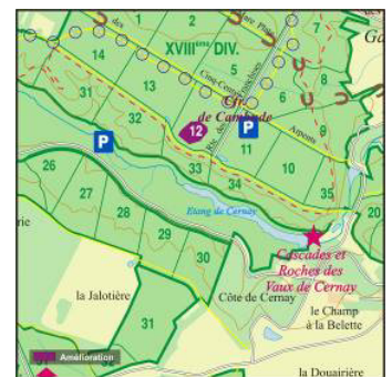
Illustration d'une coupe d'amélioration

La coupe d'amélioration programmée sur une surface de 8 hectares consiste à exploiter certains arbres désignés par les forestiers afin de donner plus d'espace et de lumière à leurs voisins et de favoriser les arbres les mieux conformés.