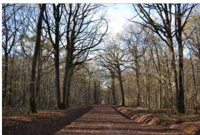
Illustration d'une coupe d'amélioration